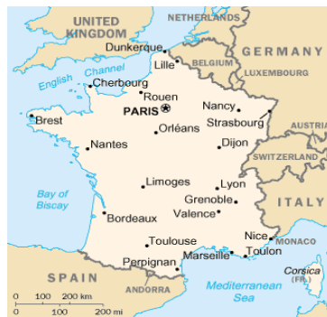
une carte de la France